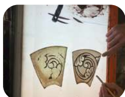
Reprise des pièces peintes