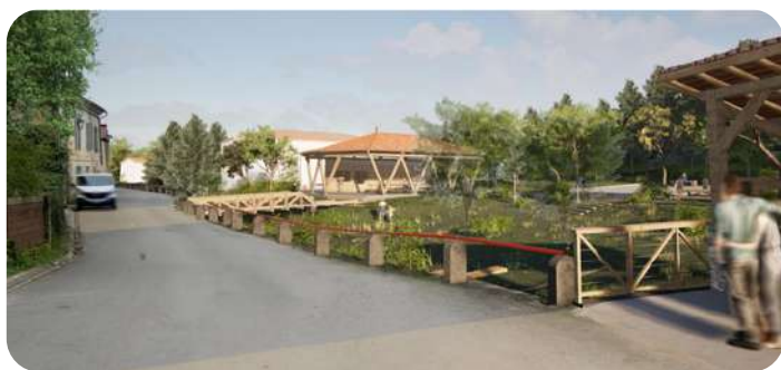
REVITALISATION DU BOURG DE ROUQUEY

Rendez-vous à la rentrée pour l'inauguration !