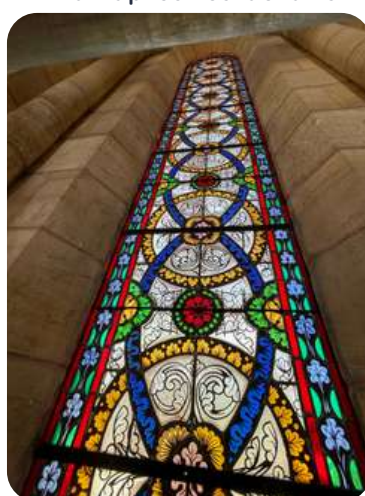
Vitrail après restauration