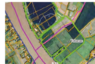
Parcelle Natura 2000 Tabanac (en mauve limite communale avec Baurech)