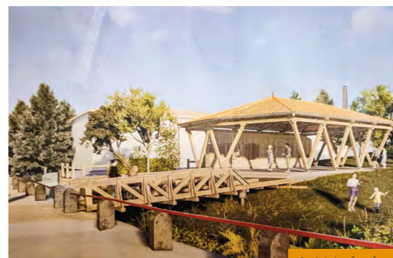
Projet de réaménagement de la place de Rouquey