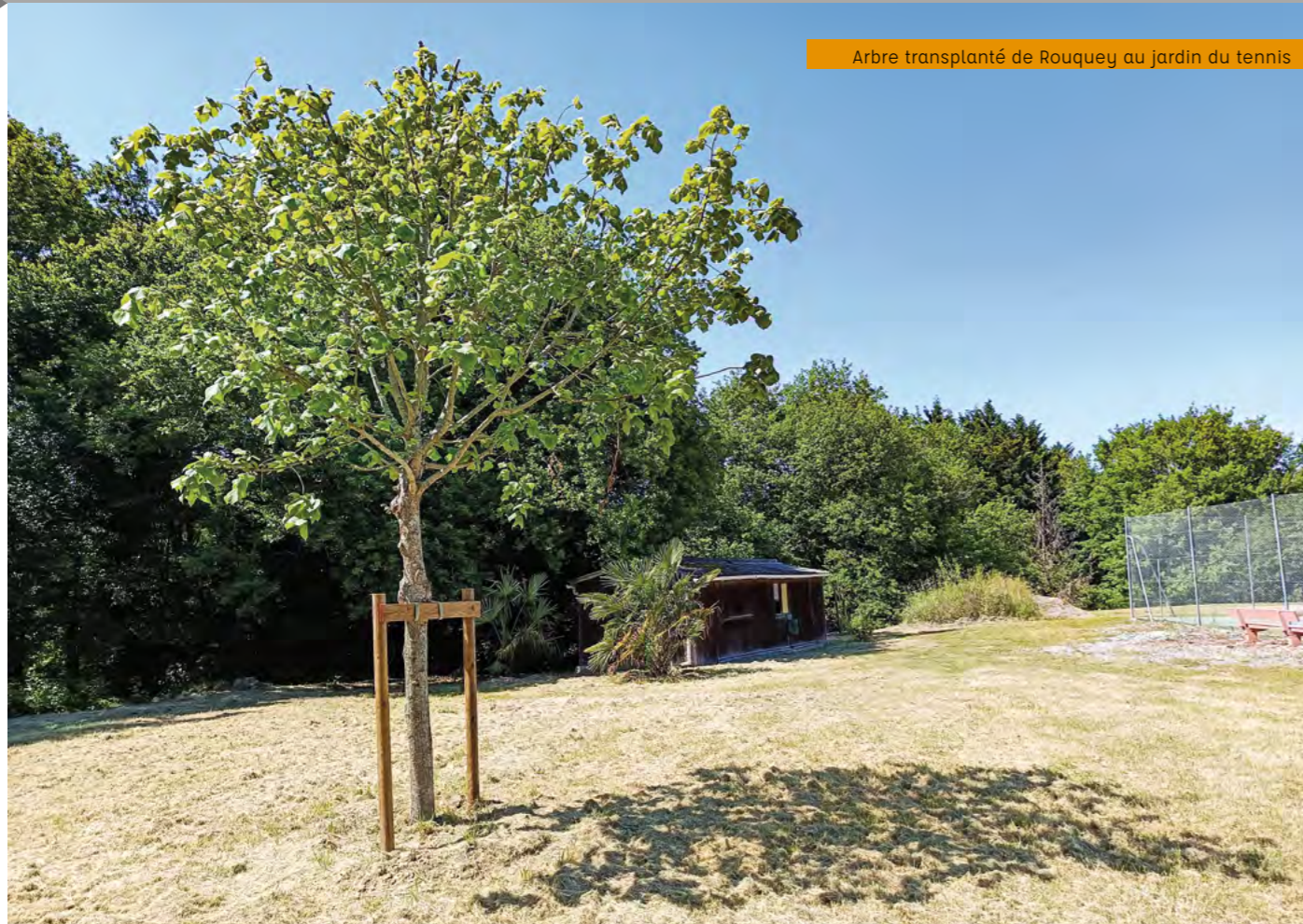
Arbre transplanté de Rouquey au jardin du tennis