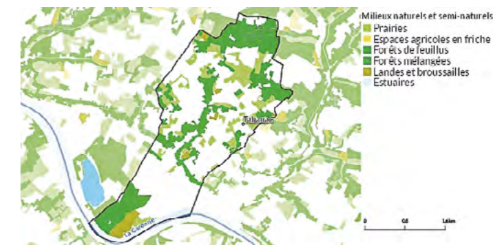
Carte des espaces agricoles et naturels