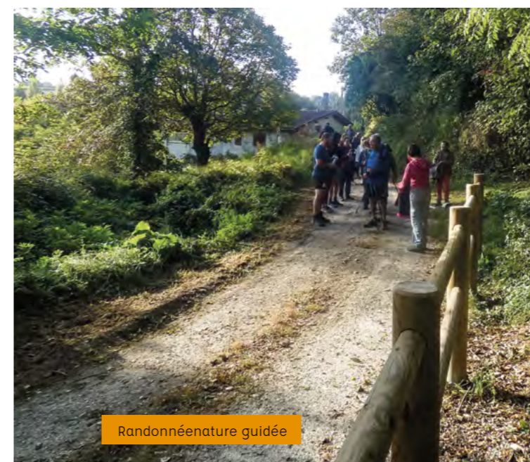
Randonnée nature guidée

Le réaménagement et le "verdissage" de la place Rouquey" a paradoxalement conduit à enlever des arbres qui risquaient d'être mis en danger par les travaux. Ils ont été déterrés et transplantés dans une autre partie du village, à côté du tennis.