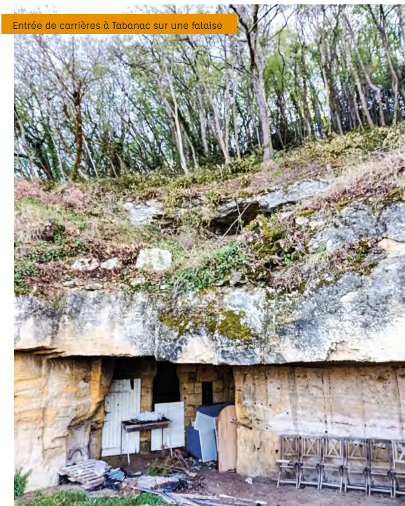
Entrée de carrières à Tabanac sur une falaise

L'alternance de périodes de sécheresse et de forte humidité a pour conséquence de faire bouger le sol de certaines maisons et d'entraîner des fissures dans les murs. Le phénomène s'est produit dans la période récente à Tabanac et a donné lieu à des déclarations de sinistre par la Préfecture et parfois à reconstruction de logement. Ce risque fait l'objet