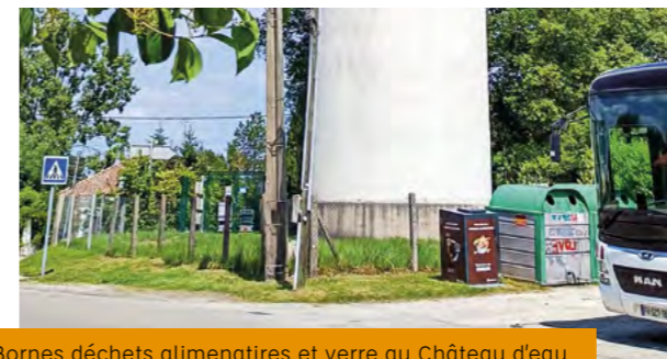
Bornes déchets alimentaires et verre au Château d'eau

Mieux trier et réduire à la source la production de déchets. Voici la priorité. Bien sûr pour préserver notre environnement, mais aussi parce que la gestion des déchets ça coûte cher. En effet chaque habitant paie pour le ramassage et les déchèteries. La gestion de ce service est faite par un organisme intercommunal, le SEMOCTOM : 97 communes, 7 communautés de communes, 138 000 habitants de l'Entre Deux Mers et du Sud Gironde.