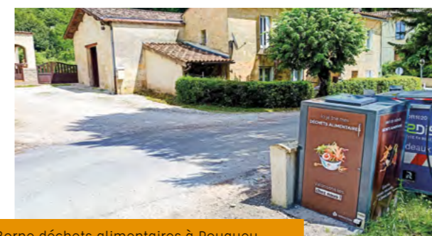
Borne déchets alimentaires à Rouquey