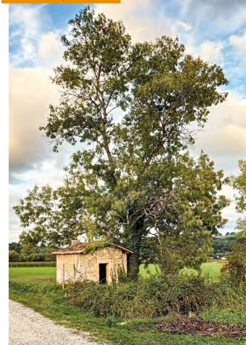
Haie classée en patrimoine naturel