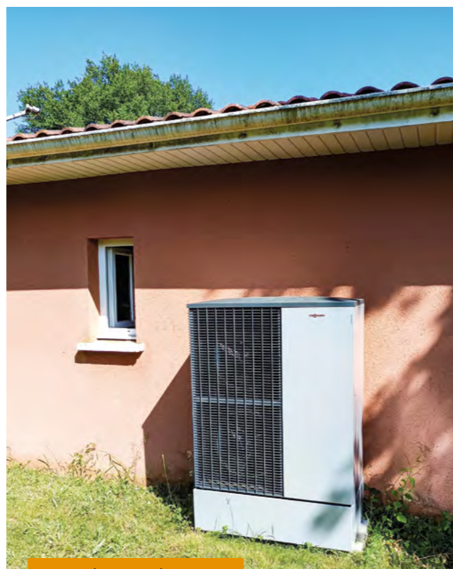
Pompe à chaleur à Tabanac