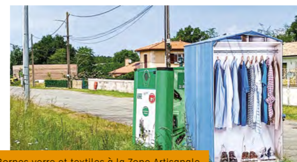
Bornes verre et textiles à la Zone Artisanale