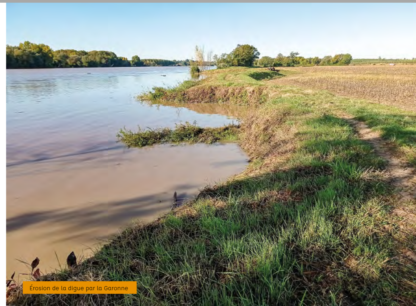
Érosion de la digue par la Garonne

http://www.cdc-portesentredeuxmers.fr/vie-quotidienne/amenagement-du-territoire/gestion-des-milieux-aquatiques-et-prevention-des-inondation/