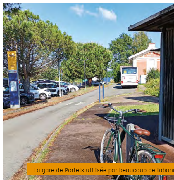
La gare de Portets utilisée par beaucoup de tabanacais