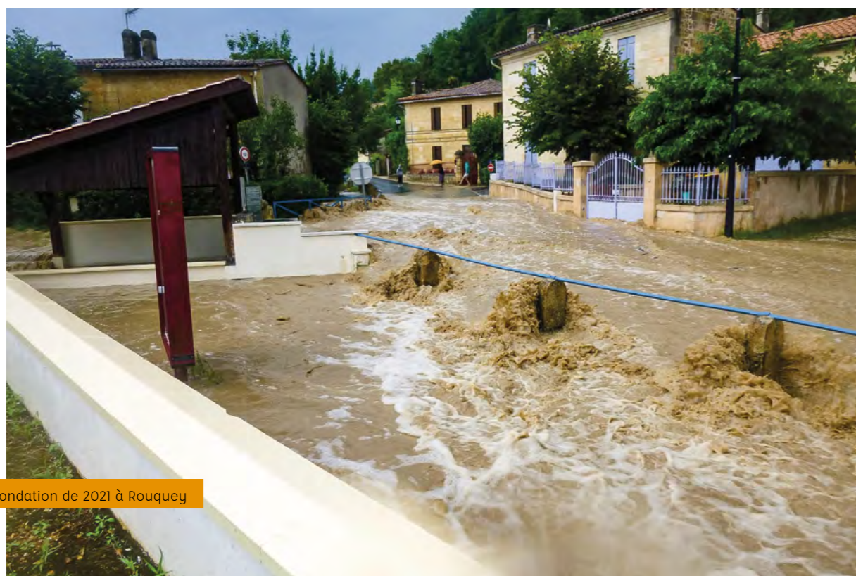
Inondation de 2021 à Rouquey

Liaison pédestre nord-sud : on pourrait envisager, en accord avec les propriétaires des terrains traversés, un parcours piéton allant de la source de cet estey entièrement tabanacais jusqu'à la Garonne. Cela permettrait une découverte de ce site nature et une sensibilisation à sa préservation.