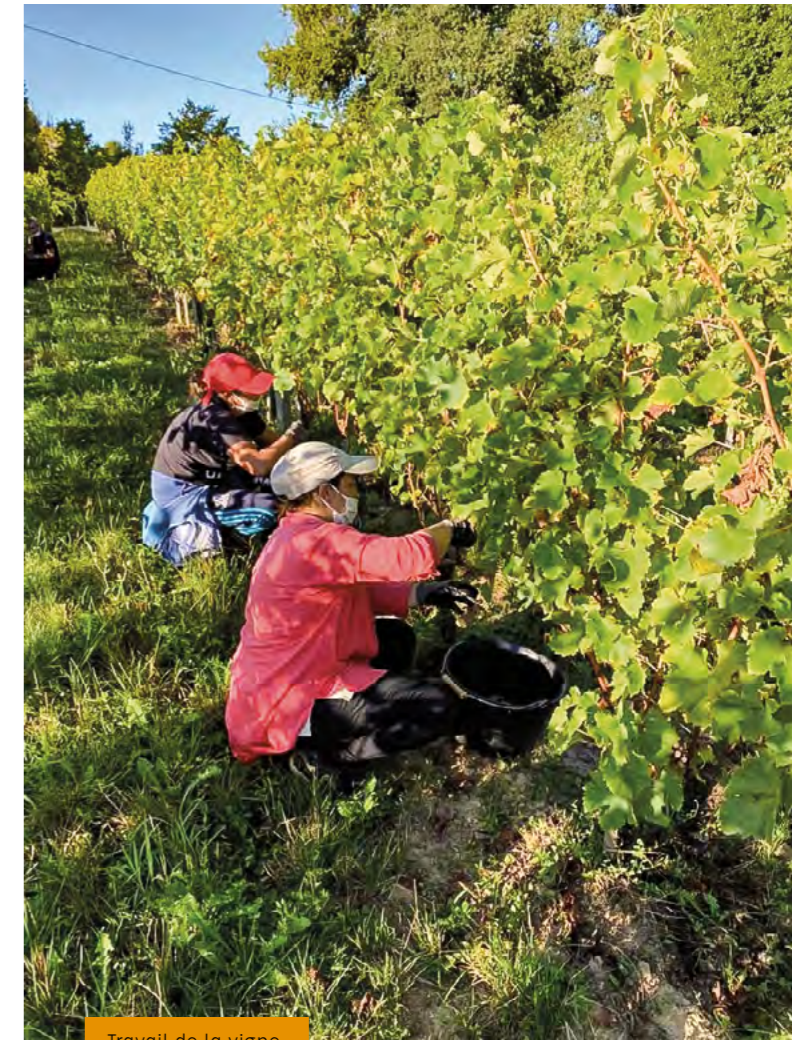
Travail de la vigne

Il est possible dans de bonnes conditions sur des terres humides, ce qui est le cas dans le secteur des palus. Son développement s'inscrit dans une logique de circuit court.